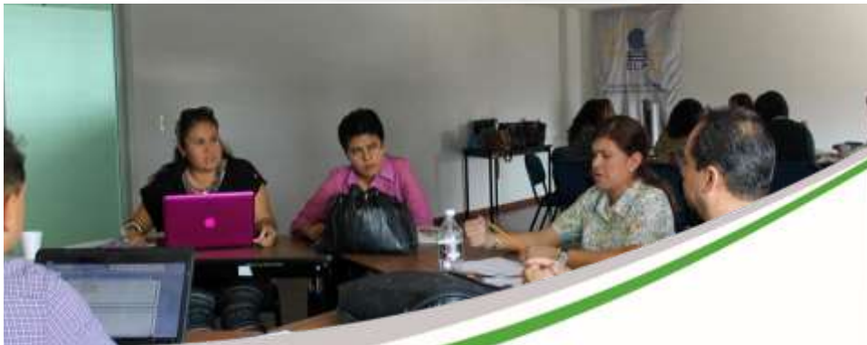
Curso Elaboración de Secuencias Didácticas Noviembre 2017