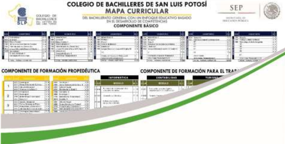
Revisión de los nuevos programas de estudio para las asignaturas del componente básico correspondiente al segundo semestre Noviembre 2017