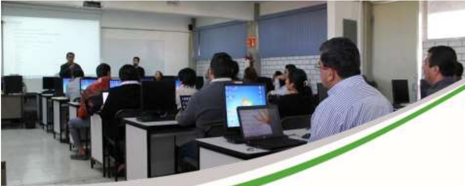
Asesoría y seguimiento para Incorporación de Planteles al Padrón de Buena Calidad del Sistema de Educación Media Superior Noviembre 2017