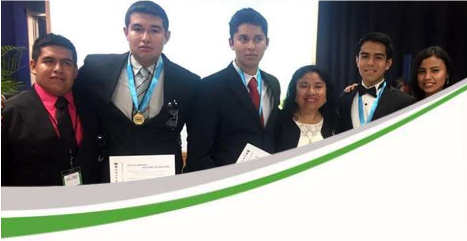
Concurso Académicos Noviembre 2017