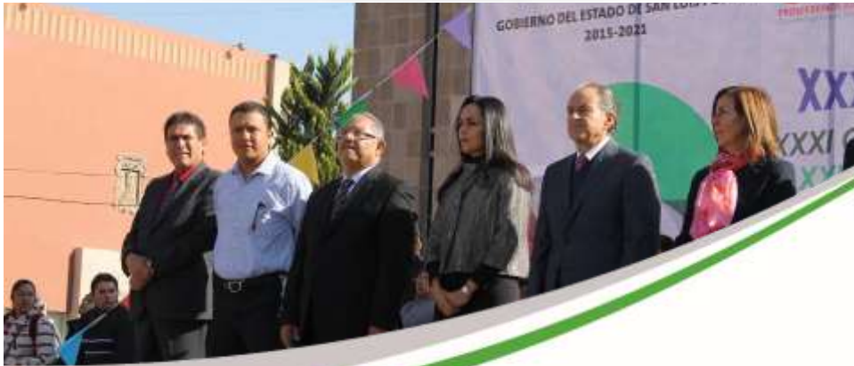
XXXIV Muestra Deportiva y Cívica del 19 al 22 de Noviembre Noviembre 2017