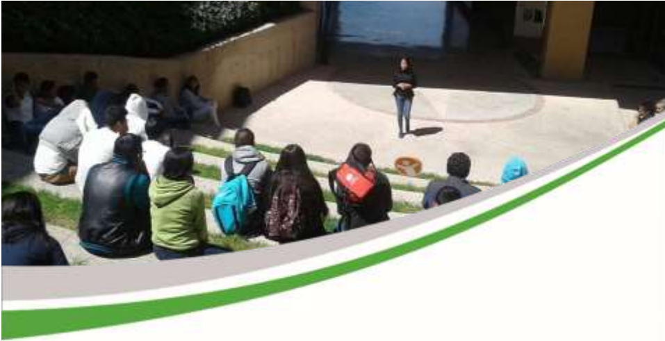
Coordinación del programa “Lideres del mañana” Noviembre 2017