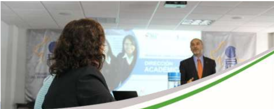
Programa de Mejora de la Calidad Educativa Noviembre 2017