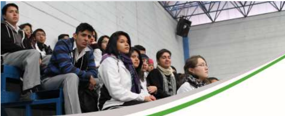
Semana para la Prevención de las Adicciones Octubre 2017