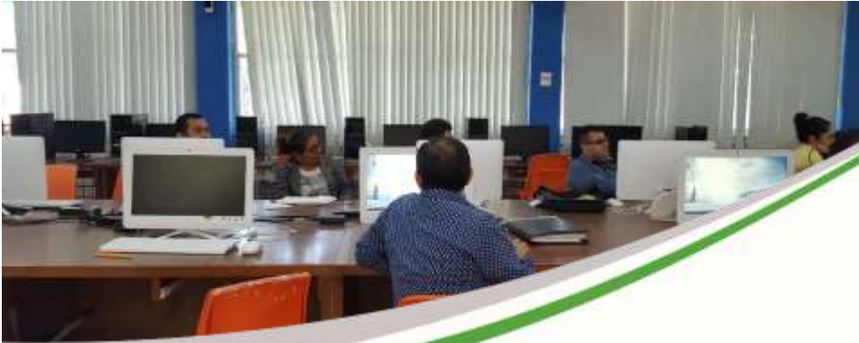
Curso en línea líderes Construye-T Noviembre 2017