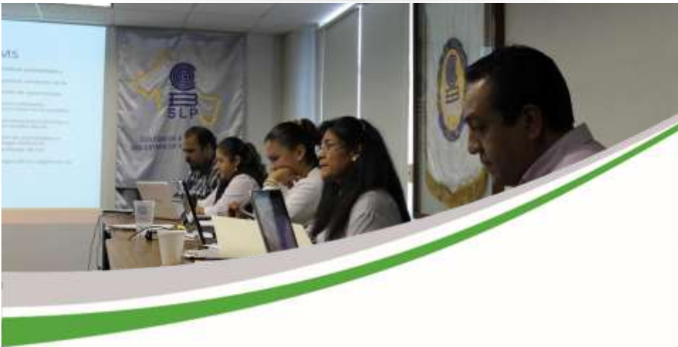
Actualización de libros de COBACH Noviembre 2017