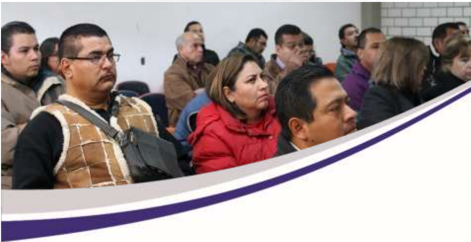
Jubilaciones: Planteles y Centros EMSaD, Jubilaciones 72, Pensionados 29, Procesos de Jubilación 9, Licencias Sin Sueldo 1 Noviembre 2017